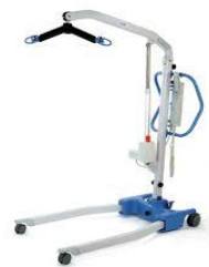
Levage mécanique complet