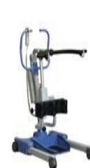
Position assise à debout

Veuillez communiquer avec le CDM au 204-945-3000 une fois par an pour prendre rendez-vous avec un technicien.